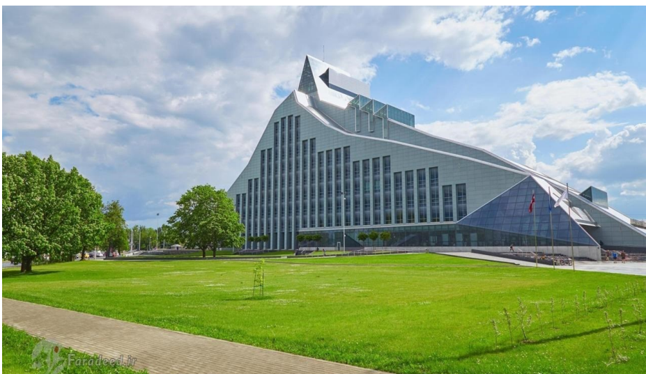
از زیباترین و مدرنترین کتابخانه های جهان کتابخانه واژه شناسی، دانشگاه آزاد برلین، آلمان

افکار و اندیشه های انسان به گونه ای است که ممکن است فقط خواندن یک کتاب پایه اندیشه ها و افکار انسان را بر مبنای جدید یا در مسیر خاصی قرار دهد و چه بسا ممکن است کتابی مسیر سرنوشت میلیون ها انسان را در راه مخصوصی بیندازد.